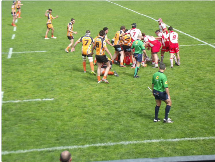
Vic en Ovalie