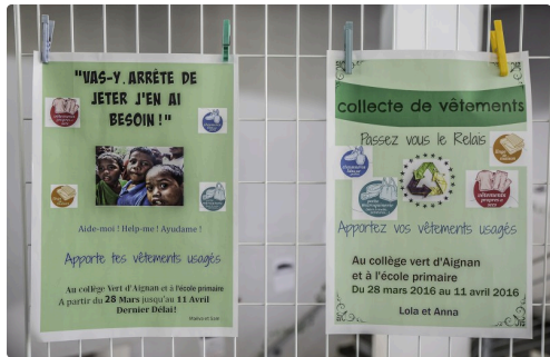
Deux des affiches de l'opération