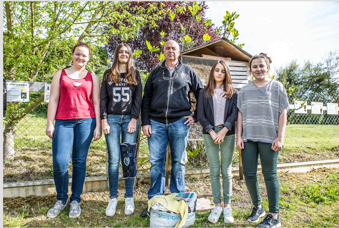
Le Collège vert d'Aignan se lance dans le réemploi avec « Relais »

« Apporte tes vêtements usagés, j'en ai besoin ! »