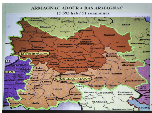
Solution avec la CCBA