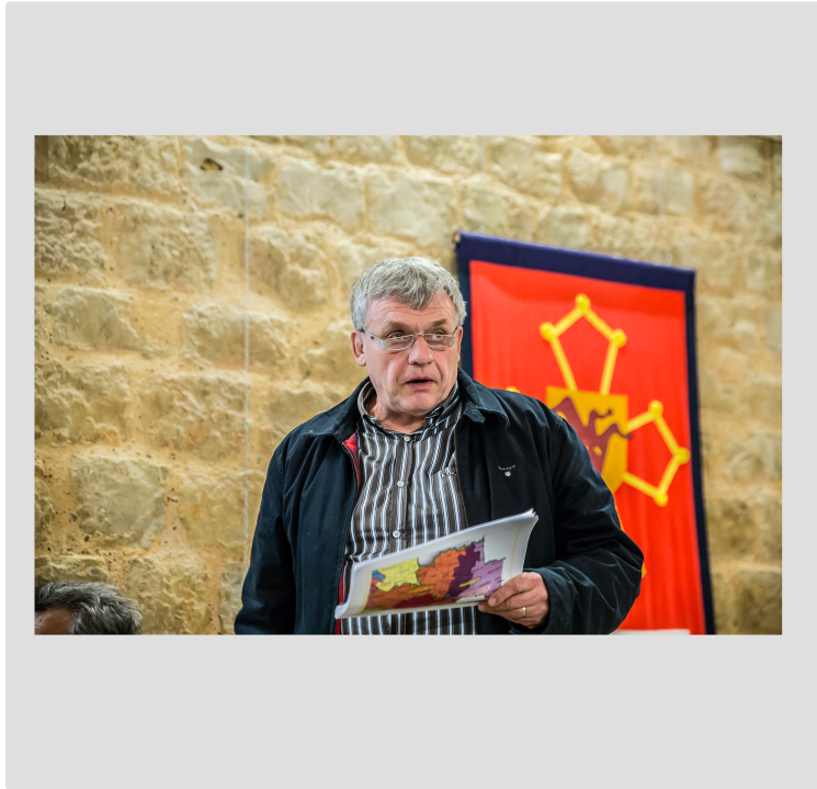
Avec qui se marier ? La question est posée à Riscle et Aignan

On se souvient que la loi impose que les communautés de communes aient au moins 15 000 habitants. La CCAA (Communauté de communes Armagnac-Adour qui réunit les ex-cantons d'Aignan et de Riscle) n'a que 7 000 habitants (environ). Certes, elle a un sursis pour fusionner, car elle a déjà subi une fusion en 2013-2014. mais pour combien de temps ? Le conseil de la CCAA s'est réuni le 11 avril à Termes-d'Armagnac et a discuté essentiellement de cette question. Car les conseillers préfèrent choisir eux-mêmes leur avenir plutôt que de se le voir imposé un jour ou l'autre. Même s'ils sont conscients qu'il n'y a pas de véritable urgence.