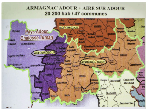
Solution avec Aie-sur-l'Adour