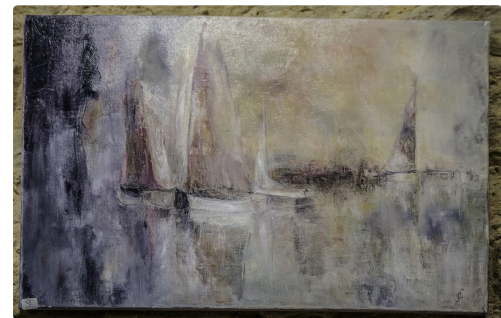
Douceur aquatique, de Jacotte Feugère