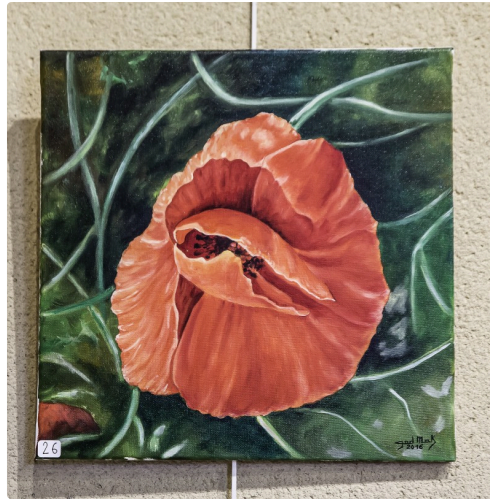
L'énergie de la rose, de God Mak