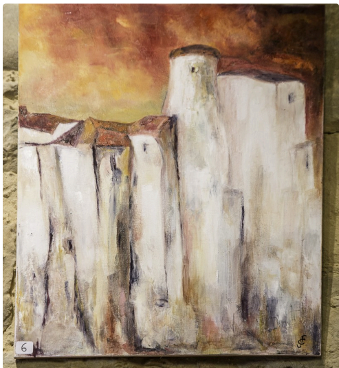
Village du Sud, de Jacotte Feugère