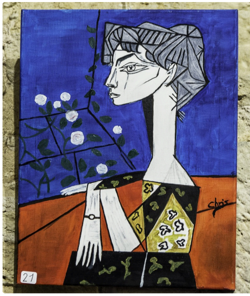
"Jacqueline" de Christiane Magenc, d'après Picasso