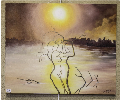
Les Inséparables, de God Mak