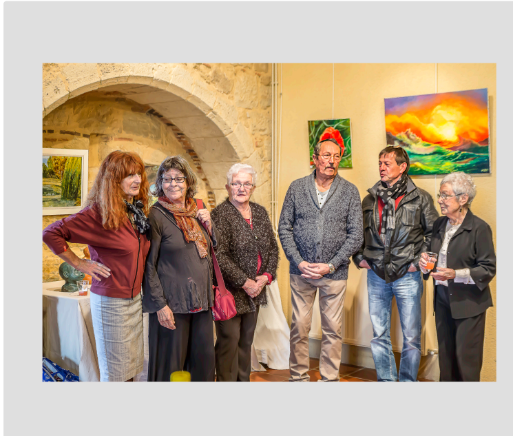
Des peintures très variées à Aignan

God Mak et des membres de la Chrysalide exposent en avril