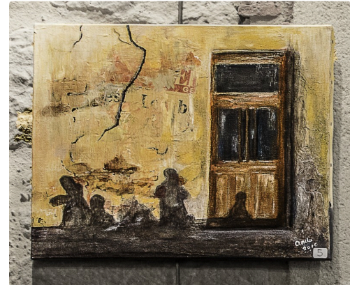
La porte d'Aignan, d'Anita Couzij