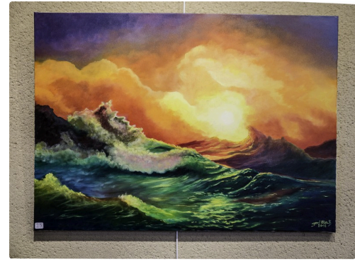
La vague de Neptune, de God Mak