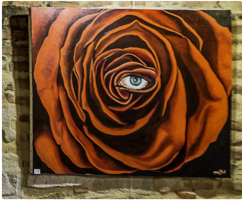
Clin d'oeil de God Mak