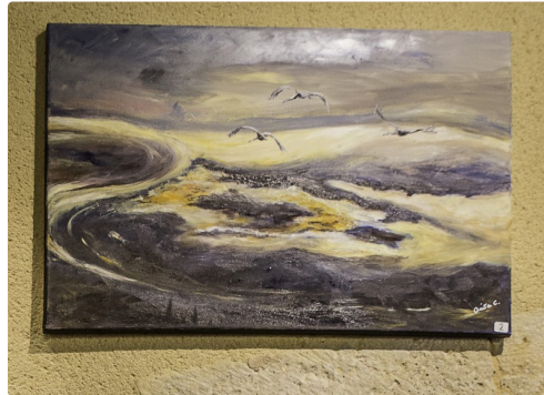
les grues reviennent, d'Anita Couzij