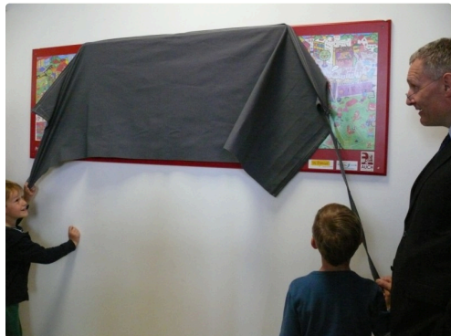
Presque dévoilée ...