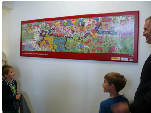
Et voilà la fresque multicolore.