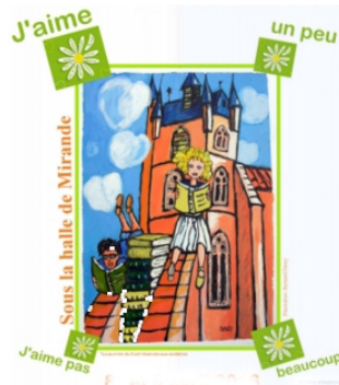
Salon du livre jeunesse

Rencontres avec des auteurs et des surprises