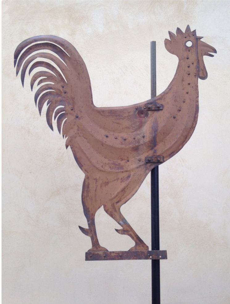
Le coq de notre clocher à la rencontre des Mirandais.