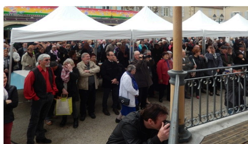
On se pressait autour de la distribution de tourteaux et de vin blanc