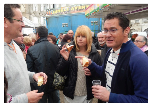
Ceux- là comme les autres ont apprécié