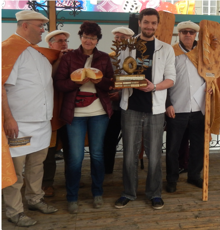
Les traditions demeurent en Astarac

Le titre de Roi des tourteaux se disputait Lundi à Mirande.