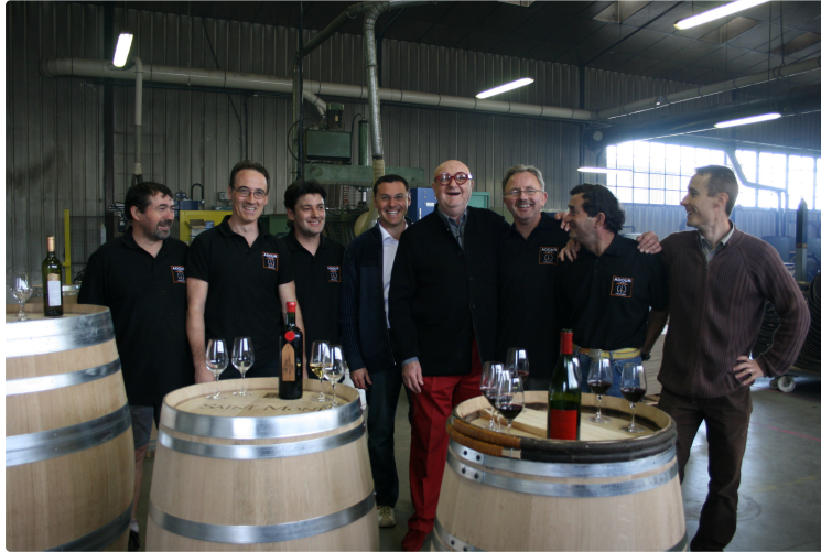
Jean-Pierre Coffe le premier parrain du Saint-Mont en fêtes est décédé

Il avait particulièrement apprécié Plaisance