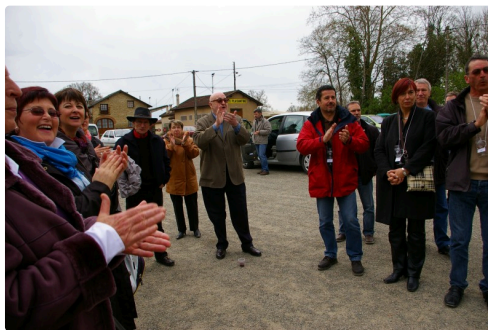
Son arrivée aux arènes avait été applaudie