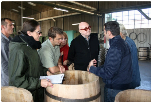
Le travail à la tonnellerie l'avait intéressé