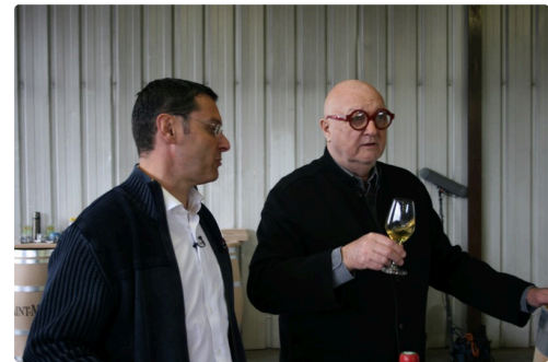
Il apprécie un produit valorisé par le bois de la barrique