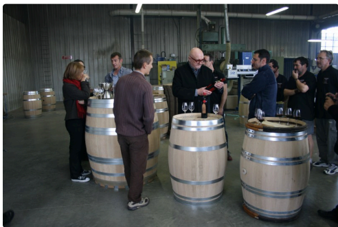
Le moment de partage avec toute l'équipe