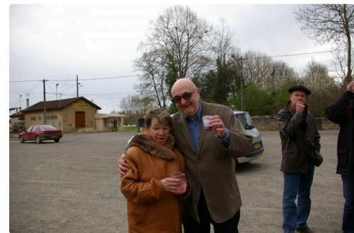
La pose avec une supportrice