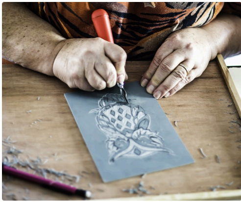
Travail avec la gouge