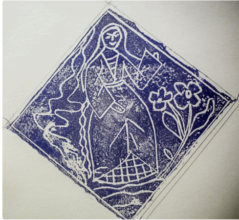
Travail en cours