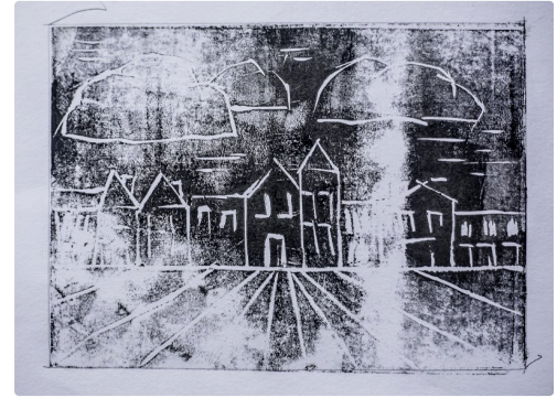
Autre travail en cours