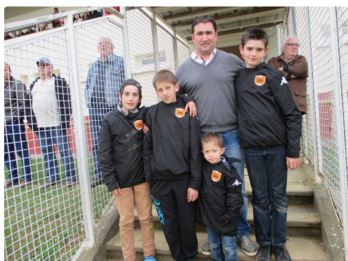
Famille Palacin sponsor des jeunes