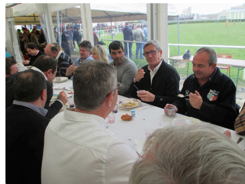
Excellente ambiance à table