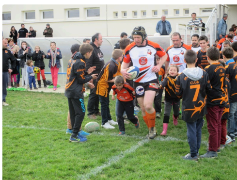
Haie d'honneur de l'école de rugby