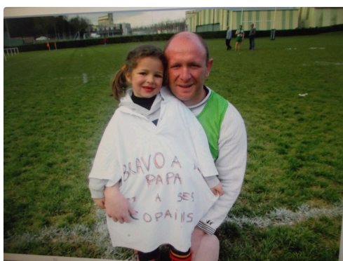
La plus jeune supportrice