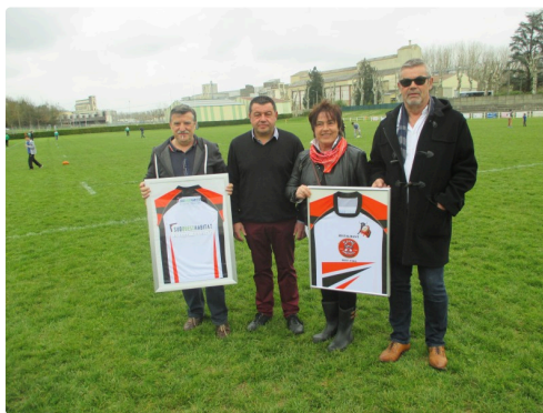
Les sponsors présentent les nouveaux maillots