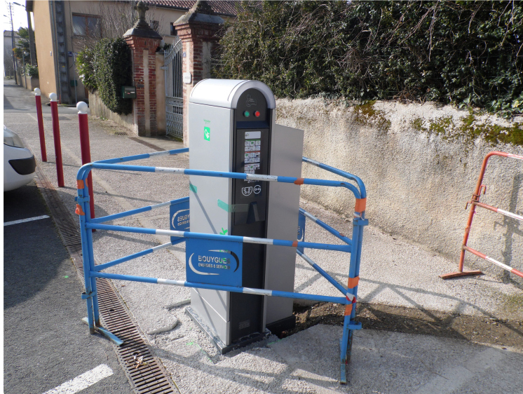
Une borne pour les véhicules électriques