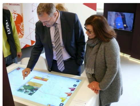
Une tablette tactile où foisonnent des dizaines d'informations.