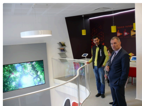
L'espace branché du 1er étage.