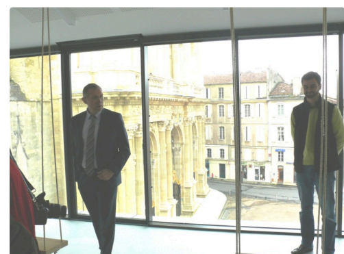
Au 3ème étage vue magnifique sur la cathédrale.