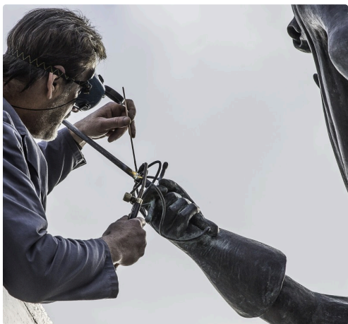
Gros plan sur la soudure