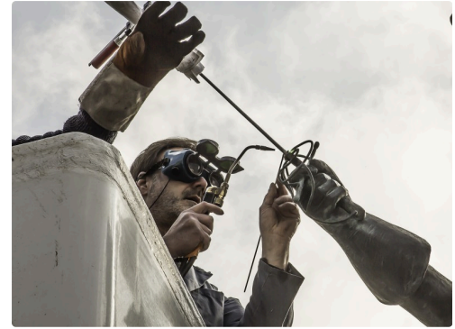
Il soude les 2 parties ; la lame est tenue par son aide