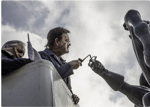
Il redresse le moignon tordu