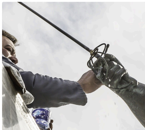
La soudure apparaît en relief