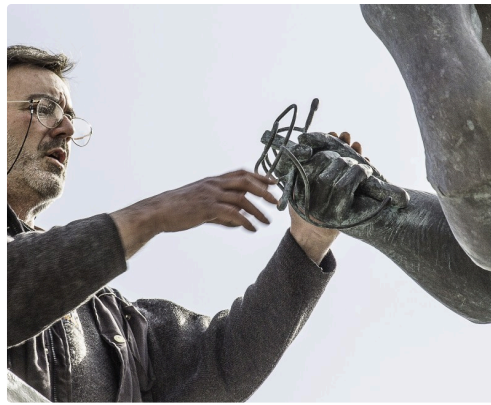
La même en gros plan