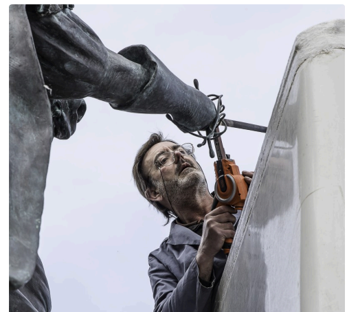
Meulage de la soudure