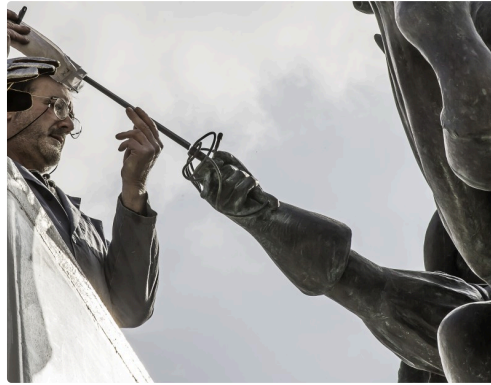
Il vérifie l'alignement