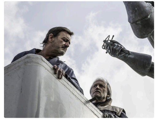
Il revient avec un aide