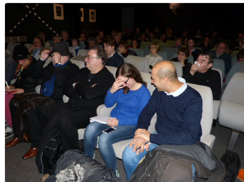
une salle bien garnie

Cette conférence menée de main de maître par le président s'est déroulée dans une ambiance unique mêlant chaleur,enthousiasme, passion pour cette musique venue de l'autre côté de l'Atlantique et qui occupe une place très importante dans le coeur des habitants de la lointaine Gscogne