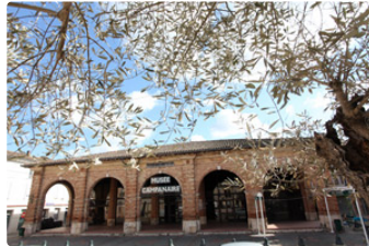
L'ISLE-JOURDAIN / Activités culturelles non-stop