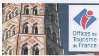
LOMBEZ-SAMATAN / MANIFESTATIONS