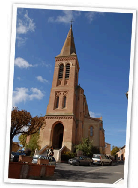
patrimoine-1 - Copie.jpg