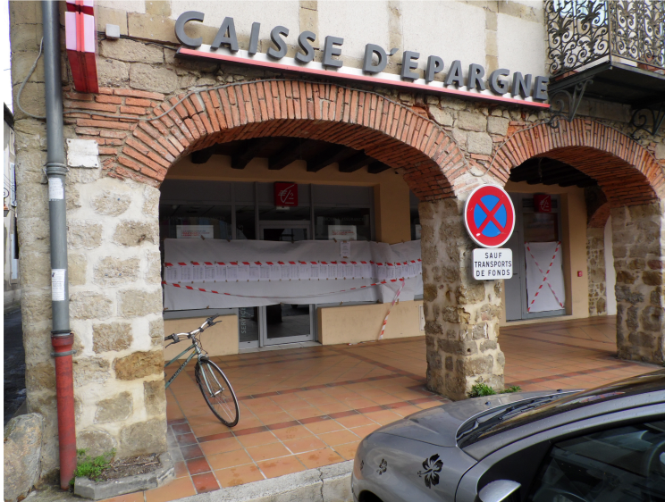
L'agence de Caisse d'Epargne qui ferme fin mars

L'expression de la colère qu'expriment les Plaisantins devant la décision irrévocable de "La Caisse d'Epargne" de fermer le bureau de Plaisance pour aller à Marciac n'est pas dirigée contre le voisin Intercommunautaire qui n'en est pas plus responsable que Nogaro de la fermeture de Riscle ou Rabastens de Bigorre de celle de Maubourguet mais bien parce que le fait accompli a été imposé . La réaction est, a été, et reste vive jusqu'à l'outrance écrite parfois, mais en cette période où les fermetures se font ou menacent de se faire chacun à sa manière de réagir car après tout la France est heureusement une démocratie où tous peuvent librement s'exprimer . Devant l'agence de la Caisse d'Epargne de Plaisance ce mécontentement s'est exprimé ce vendredi matin , une grande banderole ou étaient accrochées les pétitions portant six cent signatures des mécontents a été accrochée sur la devanture . Cela ne fera pas réouvrir l'agence au delà de fin mars mais au moins les décideurs sauront à quel point Plaisance ne les aime plus maintenant . Bay bay l'écureuil les bruissements de la rumeur publique disent que les concurrents locaux se frottent les mains.