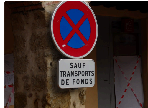
Le panneau sera maintenant plus utile sur l'autre place