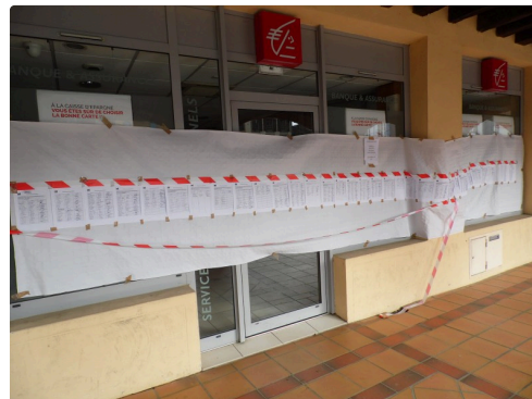
Un joli décor tout blanc