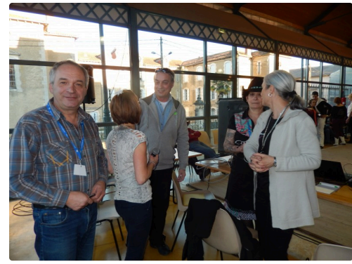
Le sourire de la réussite