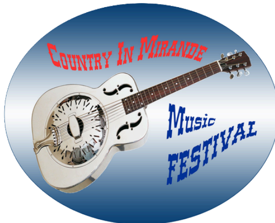
FESTIVAL COUNTRY 2016

Une édition flamboyante avec un super programme