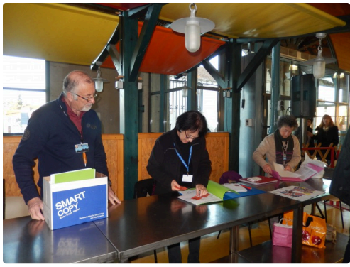
Les travailleurs de l'ombre