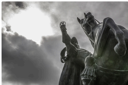
État actuel de la statue, rapière cassée