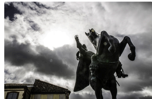
La même, vue de plus loin