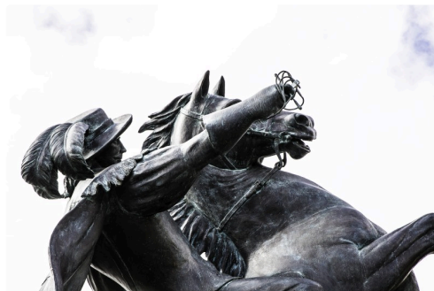
État actuel de la statue, rapière cassée, sous un autre angle