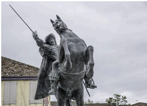
La statue le jour de son inauguration, le 9 août 2015