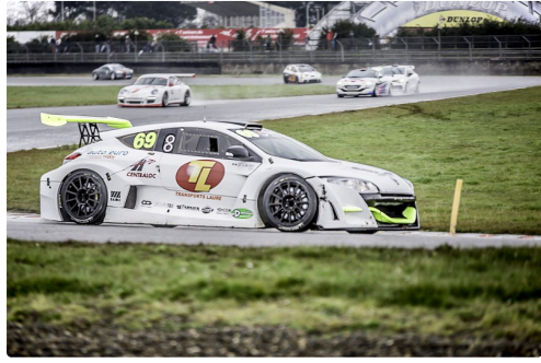
Groupe GT : la Mégane Trophy n°69 dans la course du matin