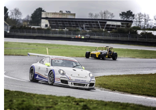
Groupe GT : la Porsche n°79 vient de doubler la Caterham n°84