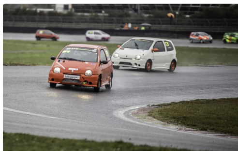
Twin Cup : le n°64 prend la tête en début de course