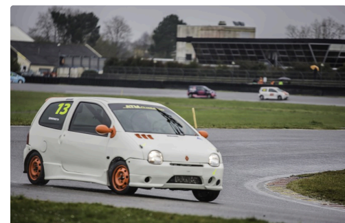
...et la garde