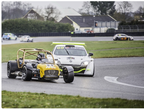
Groupe GT : la Caterham n°84 prend la tête au départ de la course du matin devant la Mégane Trophy n°69 ; la Mégane n°69 et les Porsche n°62 et 79 la dépassent petit à petit ; peut-être à cause d'une meilleure tenue dans les virages sous la pluie