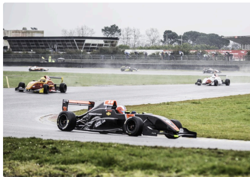
Monoplaces : début de la course du dimanche matin

Mais aucun accident corporel n'est venu ternir un week-end intense. Outre trois courses le samedi 27 février en fin d'après-midi (Groupe GT et Twin Cup), il y a eu 14 courses le lendemain dimanche, d'où des créneaux très courts entre le podium de l'une et le départ de la suivante. D'autant plus qu'il y a eu des arrêts et des reprises dans plusieurs courses.