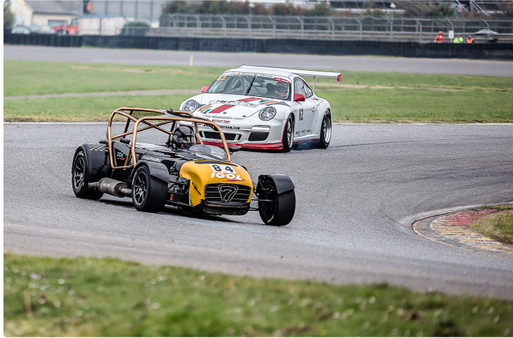
Les Coupes des circuits ont démarré à Nogaro sous la pluie

Cet article a pour but unique de présenter quelques photos prises le dimanche 28 février. Les photos prises le matin, sous une pluie battante sont de qualité médiocre : nous ne présentons donc que celles qui ont un intérêt apparent.