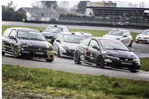
Groupe A/FA : la Honda Civic n°61 prend la t te au 1er tour et la garde