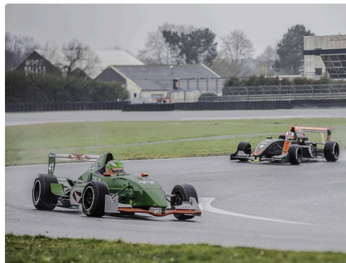
Monoplaces : milieu de course du dimanche matin