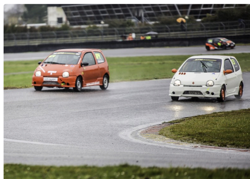
Twin Cup : le n°13 prend la tête...