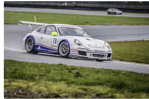
MAT groupe GT Course 2 Mégane Trophy 69 1bis 280216.jpg.jpg