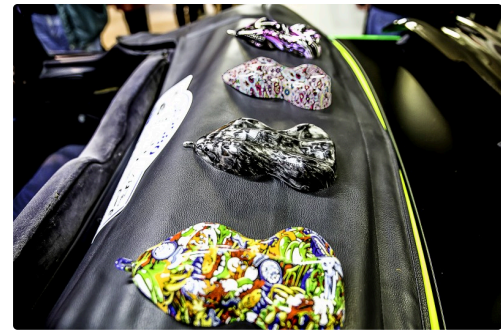
Petites maquettes de carrosseries "hydro-dippées"