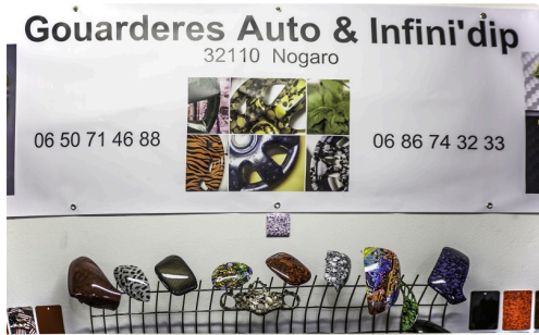
L'enseigne de la maison