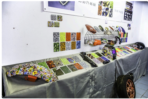
Éventaire avec pièces "hydro-dippées"