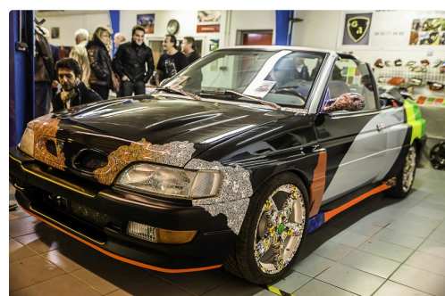
Ford Escort "hydro-dippée"

L'objet est recouvert d'une solution d'accrochage. Celle-ci une fois séchée, l'objet reçoit une couleur d'arrière-plan que l'on pourra voir (ou non, selon le choix) par transparence. Ensuite, l'objet est plongé dans l'eau, le film mis en place et le dessin transféré. Pour la finition, on ajoute un vernis brillant ou mat.