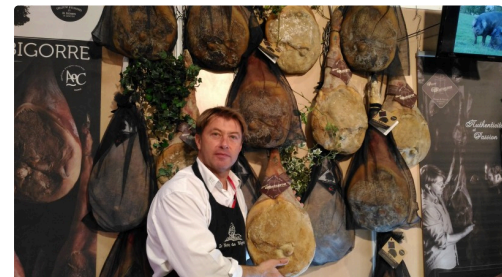
Et quelques mois plus tard pour le bonheur des gourmets