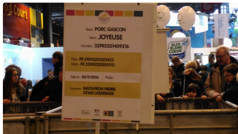
Joyeuse un pur porc noir Gascon