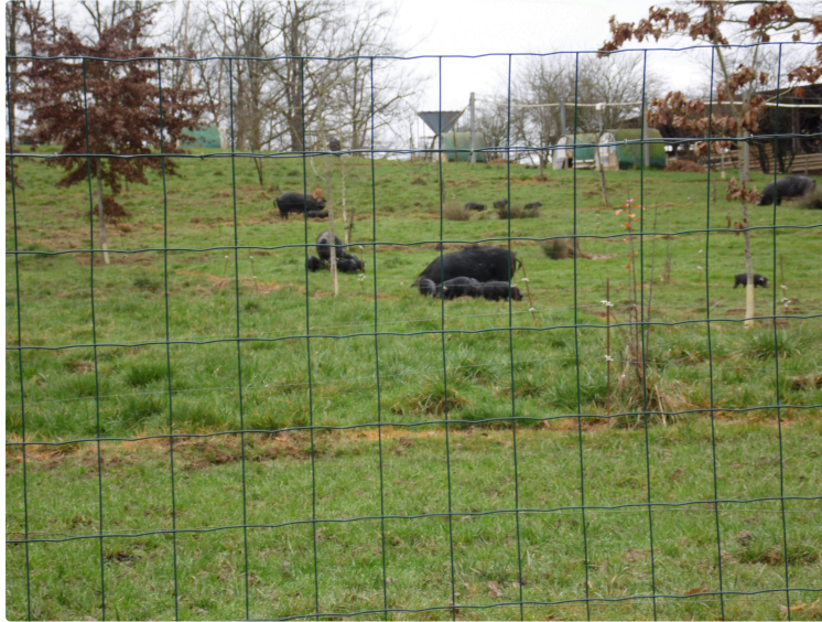
Au salon de l'agriculture

En compagnie de leur mère Joyeuse née en novembre 2014 les petits porc noirs Gascons de l'élevage que conduit Pierre Matayron au domaine de Larroche a Lasserrade font la joie des petits visiteurs qui les découvrent. Née il y a peu élevés en extérieur en totale liberté ils vont se trouver quelque peu a l'étroit durant une bonne semaine avant de retrouver la verte prairie ou ils s'ébattent jamais trop loin toutefois de leur mère nourricière dont ils savent retrouver les mamelles même au salon