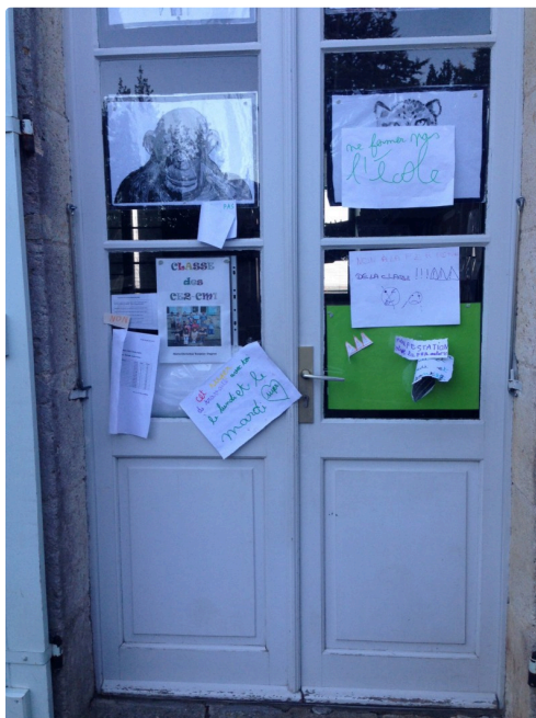
La porte de classe de l'enseignante appelée à quitter l'établissement à la rentrée.