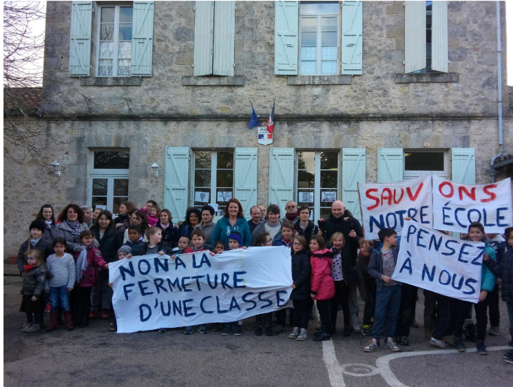
UNE CLASSE EN MOINS A TERRAUBE: Les parents d'élèves refusent ce scénario d'une fin annoncée sans ménagement.

Vendredi dernier, un rassemblement de soutien à été organisé avec la presse et les parents d'élèves.