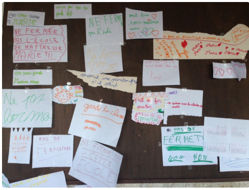
Le tableau couvert de la solidarité des enfants avec leur maîtresse.