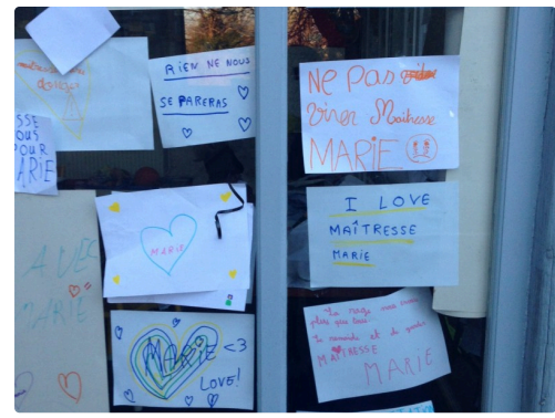
La garderie aussi...