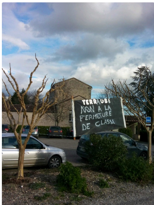
Les panneaux d'information sont mis en place.

http://www.petitions24.net/fermeture_dune_classe_ecole_terraube