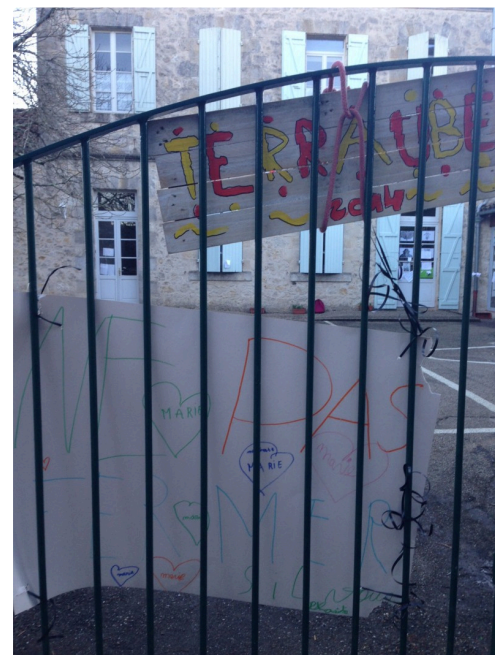
Les enfants ont "rhabillé" leur école.