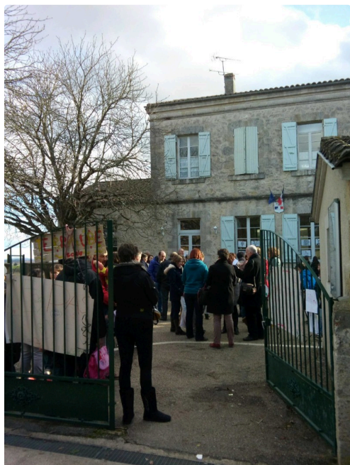
Vendredi, la cour n'était pas pleine de rires et de jeux, mais de questions et d'inquiétudes.