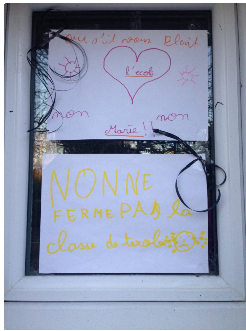
Jusqu'aux fenêtres, tous les espaces ont été occupés par les enfants.