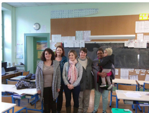
L'équipe des parents élus du conseil d'école, ont appelé au rassemblement dès vendredi pour informer les parents de la proposition "inacceptable et incompréhensible" de suppression de classe et de poste imposée par la Directrice d'Académie.