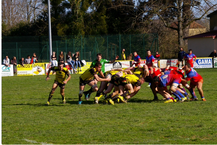
Les échos du rugby

Quatre victoires ce week-end : Deux samedi pour les jeunes deux dimanches pour les seniors