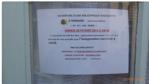
Le panneau des renseignements.