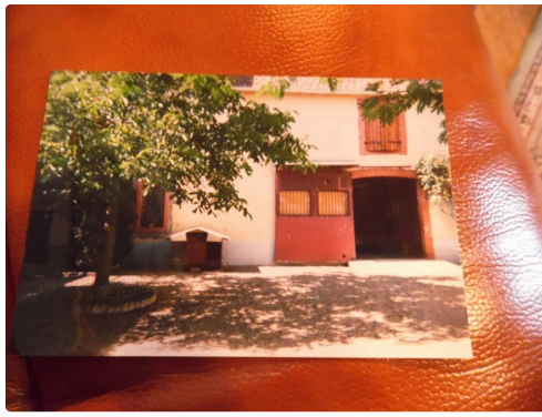
Les boxes en 1980