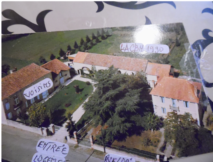
Pro-Patria le premier gagnant du prix d'Amérique est enterré a Préchac sur Adour

Il avait gagné la course en 1920 et 1921