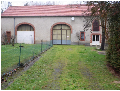
Les boxes aujourd'hui