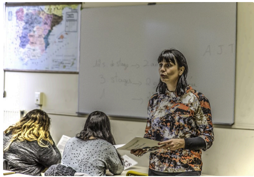
Une des présentatrices