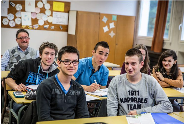
Le lycée de Nogaro présente les études supérieures

Le choix pour l'admission post-bac se termine le 20 mars