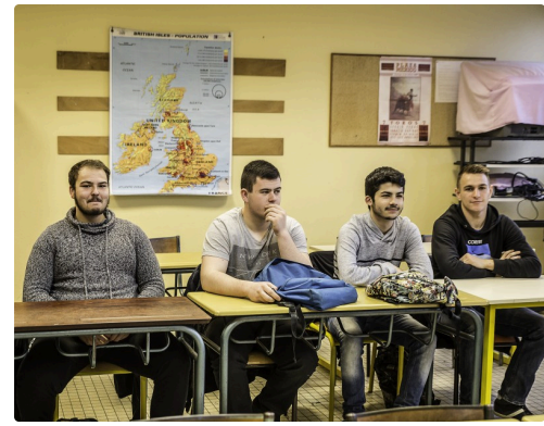
Lycéens à l'écoute