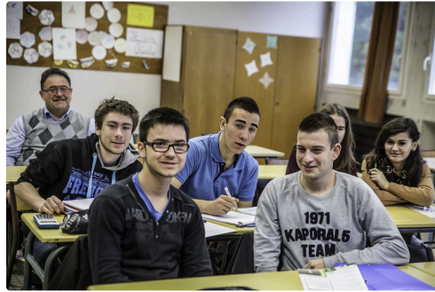
Lycéens à l'écoute