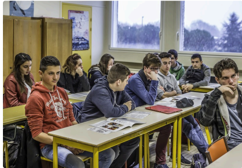
Lycéens à l'écoute