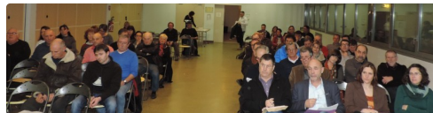
Les délégués réunis en assemblée générale