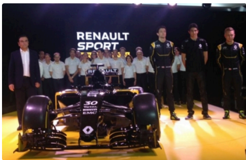
renault f1 12.jpg

Plusieurs saisons probablement pour revenir au top, trois minimum affirment les spécialistes qui soulignent aussi le changement de règlement à l'horizon 2018 comme élément favorable.